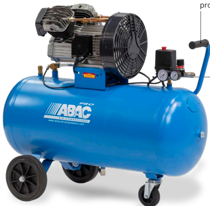
V30-2,2-50CM 2,2 kW, vzdušník 50 litrů

Tlakový spínač, regulátor tlaku, 2 manometry a výstup přes rychlospojku