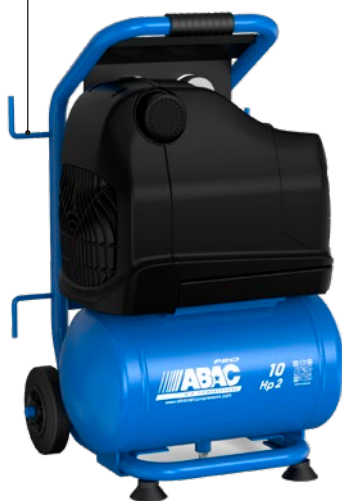
OSS20P-1,5-10RM 1,5 kW; vzdušník 10 litrů

Praktické háčky pro zavěšení kabelů a hadic