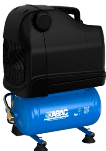
OSS20P-1,5-6RM 1,5 kW; vzdušník 6 litrů

Praktické háčky pro zavěšení kabelů a hadic