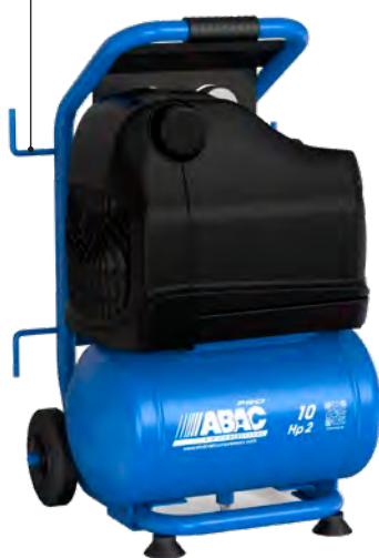
OSS20P-1,5-10RM 1,5 kW; vzdušník 10 litrů

Praktické háčky pro zavěšení kabelů a hadic