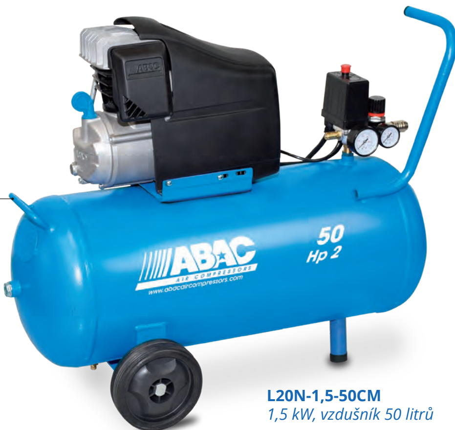
L20N-1,5-50CM 1,5 kW, vzdušník 50 litrů

Pohodlná manipulace díky přidanému madlu na tlakové nádobě