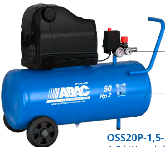
OSS20P-1,5-50CM 1,5 kW; vzdušník 50 litrů