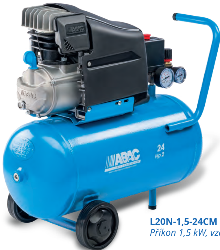
L20N-1,5-24CM Příkon 1,5 kW, vzdušník 24 litrů