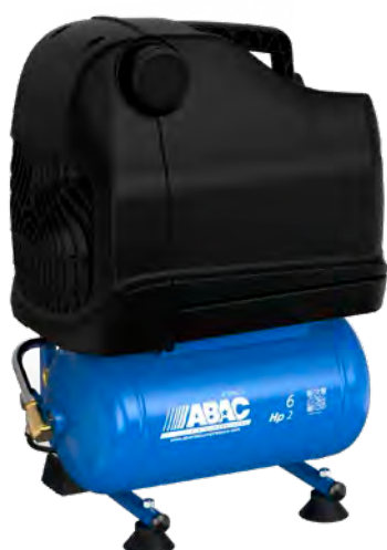
OSS20P-1,5-6RM 1,5 kW; vzdušník 6 litrů

Bezolejové profesionální kompresory s přímým pohonem v přenosném a mobilním provedení určené pro menší řemeslnické aplikace.