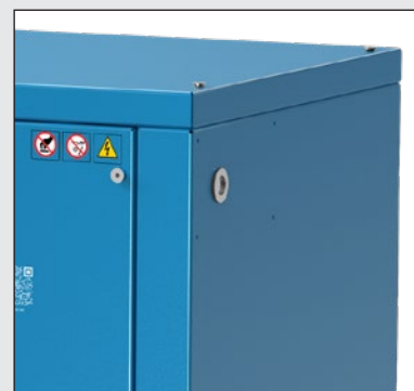
Kovové panely s odhlučňující pěnou