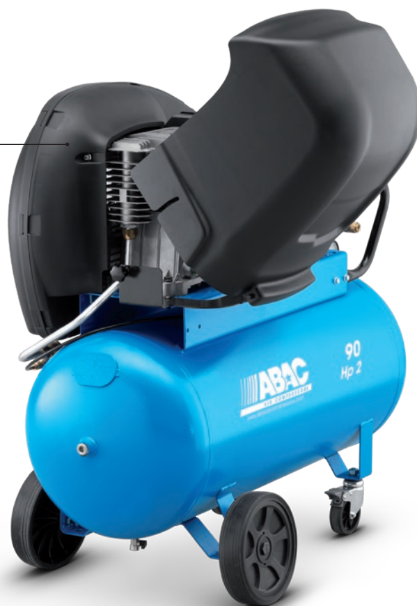
A29B-1,5-90CTS 1,5 kW, vzdušník 90 litrů