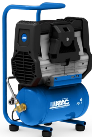
6RM - vzdušník 6 litrů

Kompresory z řady Super Silent Line splňují všechna kritéria pro moderní malý pístový kompresor - odhlučněné provedení bez drahého krytu, bezolejové, s přímým pohonem s nízkými otáčkami a v mnoha uživatelsky přívětivých konfiguracích.