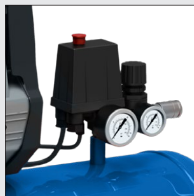
Tlakový spínač, regulátor tlaku, 2 manometry a výstup přes rychlospojku