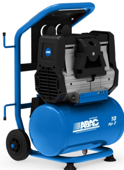
10RM - vzdušník 10 litrů