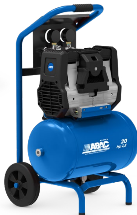
20RM - vzdušník 20 litrů