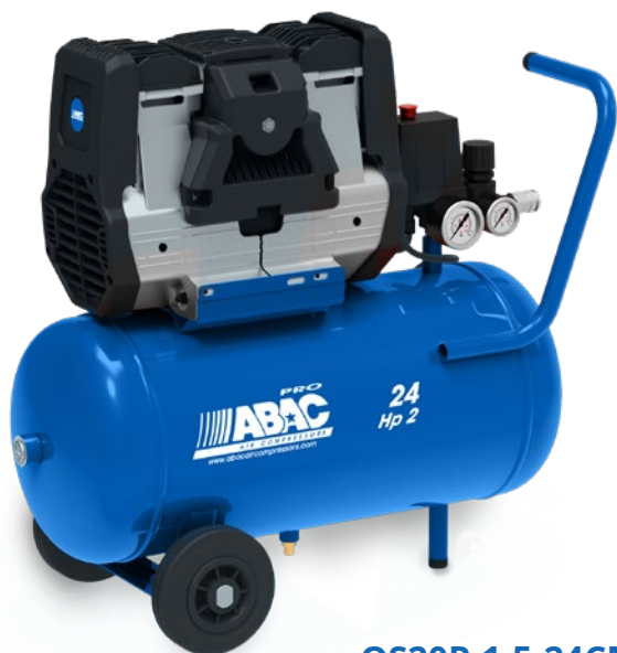
OS20P-1,5-24CM 1,5 kW, vzdušník 24 litrů