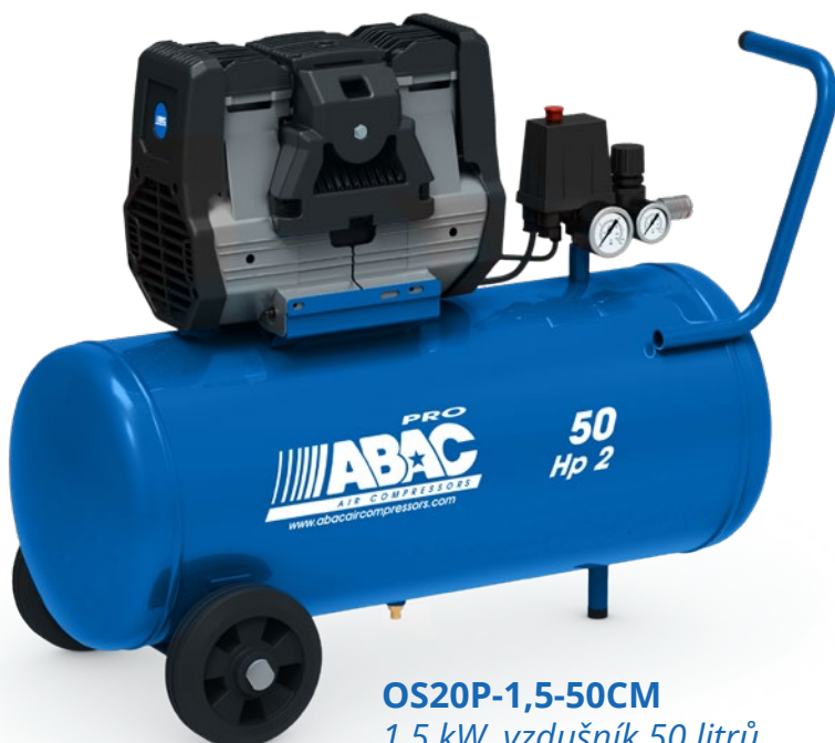
OS20P-1,5-50CM 1,5 kW, vzdušník 50 litrů