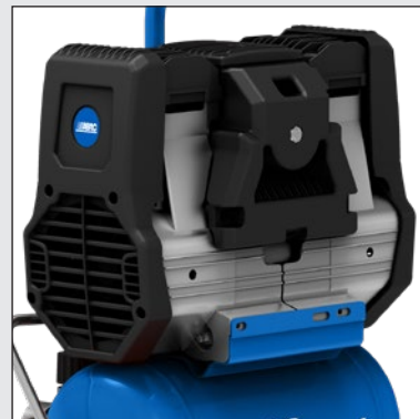
Odhlučňená jednotka se 2 písty a centrálně uloženým motorem